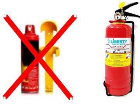
Gambar 1 Alat Pemadam Api Ringan