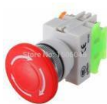
Gambar 2. Sistem Tombol Darurat ( Emergency Stop Push-Button )